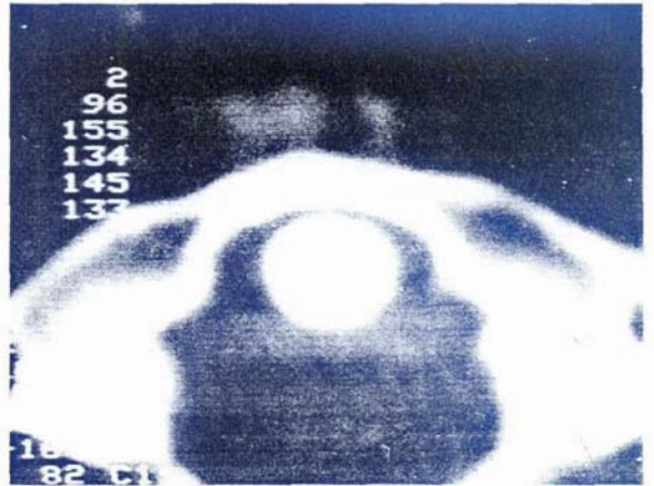
Resim IV. Elli Altıncı Gün Yapılan Servikal Kompüterize Tomografik Tetkik. Transvers Ligamentin İntakt Olduğu Görülmektedir.