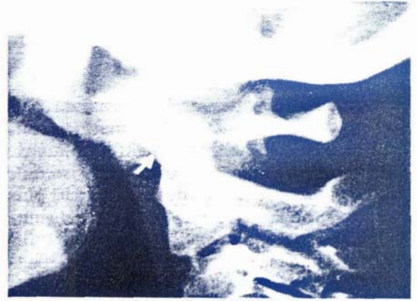
Resim II. Yirmi Birinci Gün Çekilen Lateral Servikal Grafi. Dislokasyonun Düzeldiği Görülmekte.

Romatizmal ateşle birlikte olan atlantoaxial dislokasyon ilk olarak Handyside tarafından yayınlanmış olup radyolojinin uygulamaya girmesinden önceki döneme ait bir yayın olmasına rağmen yapılan postmortem incelemele dislokasyon gösterilmiş ve transvers ligamentin durumu ayrıntıları ile tanımlanmıştır (5) . Öncelikle dislokasyonun niçin bu bölgede oluştuğunu anlamak için bölgenin anatomik özelliklerine bakmak gerekir. Bu özellikler: 1-Atlantoaksiyal eklemden stabiliteyi sağlayacak kemik yapıların yokluğu, 2-Eklemlerinin gevşek olması ve rotasyona olanak vermesi, 3-Bu bölgedeki vertebraların diğer bölgelere nazaran daha mobil olması, 4-Atlasın faset eklemine aksisinkinden da-