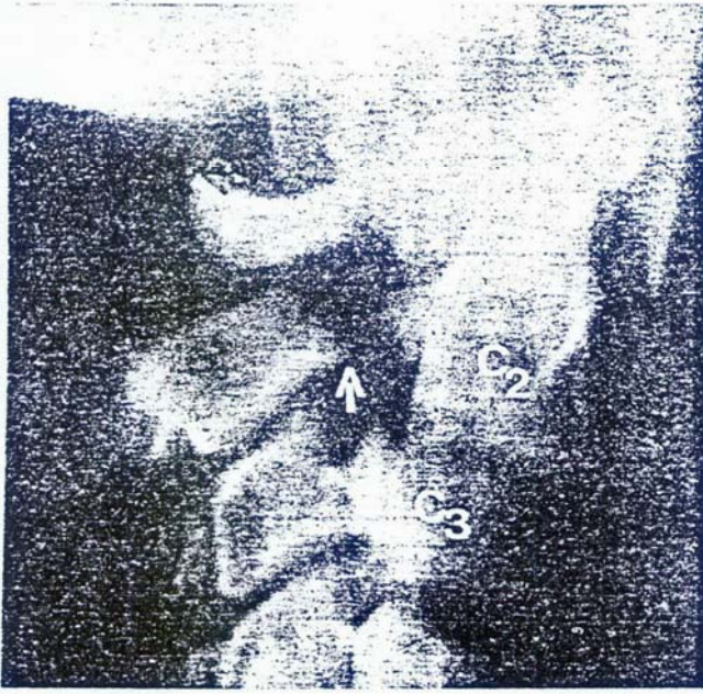
RESİM-2: Lateral planda yapılan konvansiyonel tomografide C 2 pedikülünde fraktür ve C 2 -C 3 anterior dislokasyon görülmektedir (Hangman Fr.)

immobilizasyon uyguladık ve kontrollarda kallüs oluştuğunu gözledik.