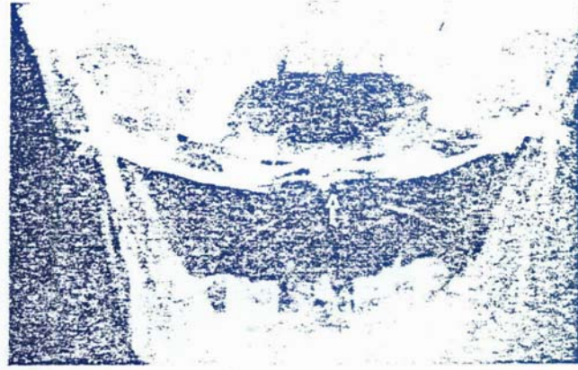
RESİM-4: Ağız olarak AP planda alınan direkt grafide dens aksisin tabanından geçen horizontal fraktür hattı görülmüyor (D'Alonzo tipi-2 fr.).

kim merkezler dışında da kısıtlı olanaklar çerçevesinde tanı- nıp tedavi edilebileceğini, tam için en küçük bir şüpheye dahi uygulanacak basit tetkiklerle kesin tanıya varılabileceği, uygulanacak konservatif tedavi ile başarılı sonuçlar elde edilebileceğini vurgulamaya çalıştık.